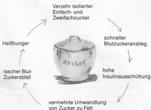
Abb. 2: Der Teufelskreis